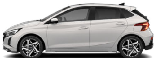
Lumen Gray Pearl Kontrastdach verfügbar