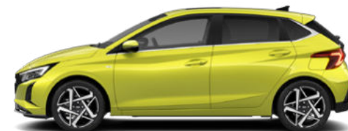
Lucid Lime Metallic Kontrastdach verfügbar