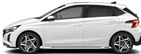
Atlas White Kontrastdach verfügbar