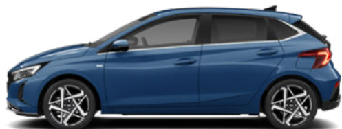
Vibrant Blue Pearl Kontrastdach verfügbar