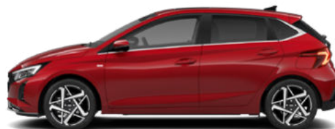
Dragon Red Pearl Kontrastdach verfügbar