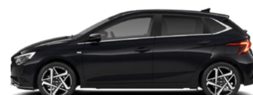
Phantom Black Pearl