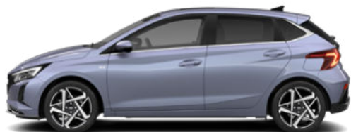
Meta Blue Pearl Kontrastdach verfügbar