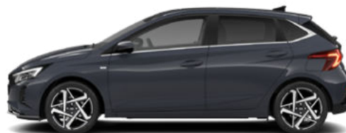
Aurora Gray Pearl