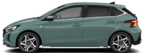
Mangrove Green Pearl Kontrastdach verfügbar