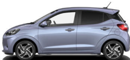
Meta Blue Pearl Kontrastdach verfügbar