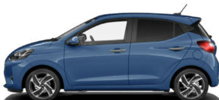
Vibrant Blue Pearl Kontrastdach verfügbar