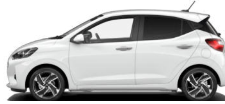
Atlas White Kontrastdach verfügbar