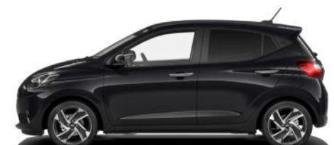
Phantom Black Pearl