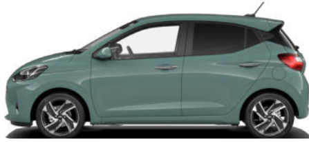
Mangrove Green Pearl Kontrastdach verfügbar