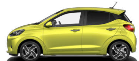
Lucid Lime Metallic Kontrastdach verfügbar