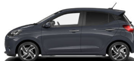
Aurora Gray Pearl