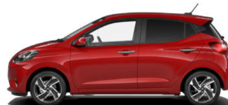
Dragon Red Pearl Kontrastdach verfügbar