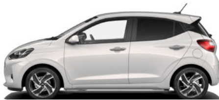
Lumen Gray Pearl Kontrastdach verfügbar